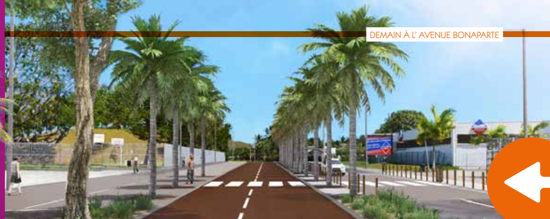
DEMAIN À L'AVENUE BONAPARTE

Les transports collectifs sont aussi actuellement les victimes de cette congestion routière récurrente puisqu'il n'existe pas d'aménagement qui leur seraient dédiés sur les points stratégiques de la circulation du Grand Nouméa. Ils sont noyés dans la circulation générale.