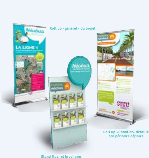
Roll up «général» du projet.