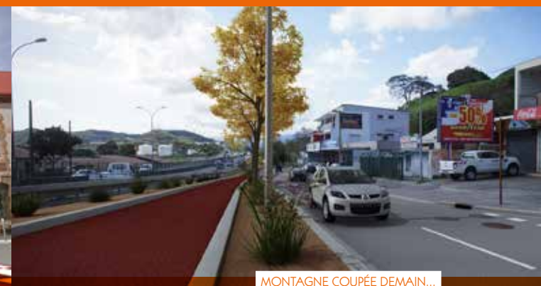
MONTAGNE COUPÉE DEMAIN...