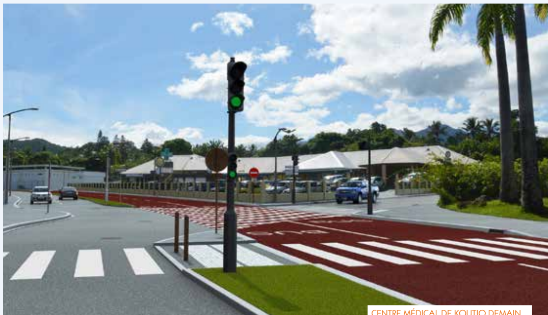
CENTRE MÉDICAL DE KOUTIO DEMAIN...