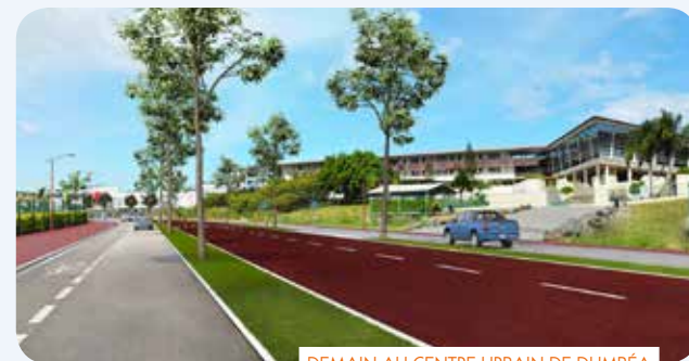
DEMAIN AU CENTRE URBAIN DE DUMBÉA

C'est un système de transport public de voyageurs, utilisant une voie ou un espace affecté à sa seule circulation, bénéficiant de priorités aux feux et carrefours, fonctionnant avec des bus nouvelle génération. Le TCSP permet donc des trajets plus rapides, des horaires respectés et une vraie qualité de voyage.