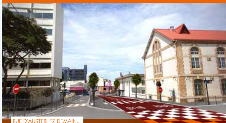
RUE D'AUSTERLITZ DEMAIN...