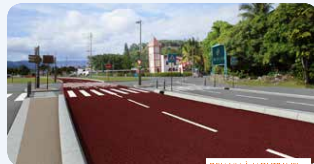
DEMAIN À MONTRAVEL...